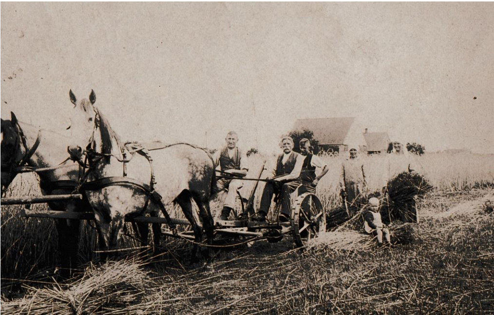
Getreidemahd um 1920 auf dem Schulacker in Hanum durch Familienangehörige, Knechte und Mägde des Bauern Nacke. Die gesamte Familie musste auf dem Feld mithelfen.

In Stöckheim fand am Sonntag nach beendeter Roggenernte ein Festessen statt, an dem alle Erntehelfer teilnahmen. Dieses bestand bei dem Bauern Bunes aus Hühnerbrühe mit Griesklößen, Reisbrei, ganzen Hühnern, Weißbrot und Kubel (Rindfleisch mit Meerrettich, geschmorten Pflaumen, Birnen und Rosinen). Dazu wurden Krüge mit Bier und Schnaps gereicht. Nach dem Essen sangen alle den Choral: „Nun danket alle Gott“. Danach spielten die Männer „Schafskopp“, und die Frauen mit den Kindern hielten sich im Garten auf. Am Nachmittag gab es noch Kaffee und Kuchen. 2