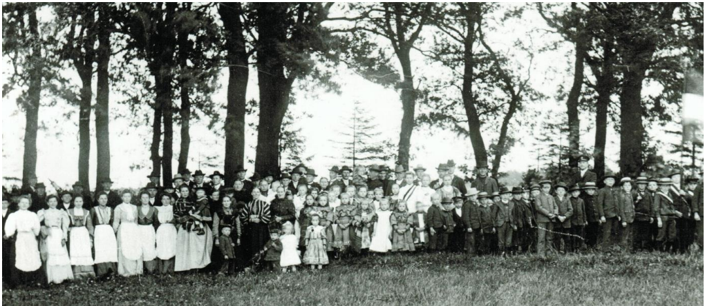
Sedanfeier in „Könneckens Eichen“ bei Hanum um 1910.

Es gibt Feste, die inzwischen gänzlich in Vergessenheit geraten sind. Zur Erinnerung an den Sieg der deutschen über die französischen Truppen in der Schlacht bei Sedan am 1. und 2. September 1870, der die endgültige Wende zu Gunsten der deutschen Truppen brachte und schließlich 1871 zur Proklamation des Deutschen Kaiserreiches führte, wurde jährlich am 2. September der „Sedantag“ begangen. Am 27. August 1919 untersagte schließlich das Innenministerium der Weimarer Republik die weitere Durchführung.