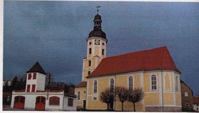
Abb. 1: Die Kirche von Kayna, Blick von Südosten.

von der aber heute jede Spur fehlt. 6 Immerhin wurde 1179 der Welfe Heinrich der Löwe, der 1180 abgesetzt wurde, nach Kayna vor Gericht geladen. 7