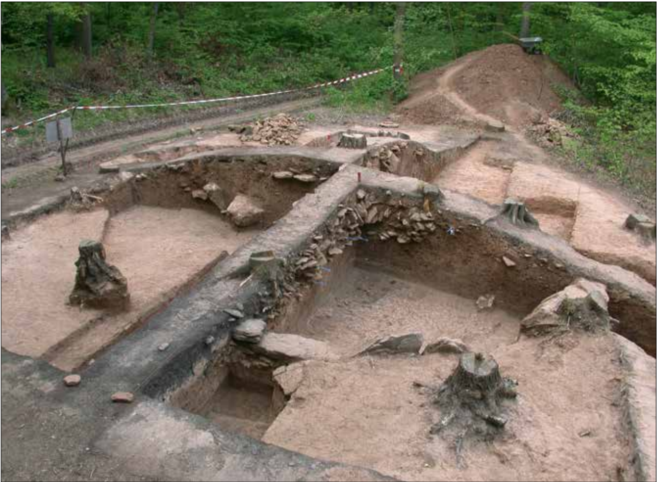
Abb. 7a Blick auf den Grabhügel von Nordost. Erkennbar sind im Bildvordergrund (Nordost-Quadrant) noch die letzten Randsteine der bronzezeitlichen Grabeinfassung. In den Profilen sind die Steine der bronzezeitlichen Steinpackungsgräber sichtbar. Die im Profil erkennbaren großen Steine im Südost-Quadranten gehören zu der neolithischen Steinkiste. Der schwärzlich gefärbte Boden im Bildvordergrund ist noch der Rest des dort gelegenen Meilerplatzes (Abb. 7b und c – Profilzeichnungen – im Anhang S. 74–75).

nahme dokumentiert. Für Laboranalysen im LAGB wurden aus den dokumentierten Profilen Bodenproben entnommen. Auch durch das LDA wurden Bodenproben an verschiedenen Stellen entnommen. Einige dieser Proben wurden 2014 von S. Polifka im Rahmen seiner Masterarbeit am Institut für Agrar- und Ernährungswissenschaften der MLU untersucht 8 .