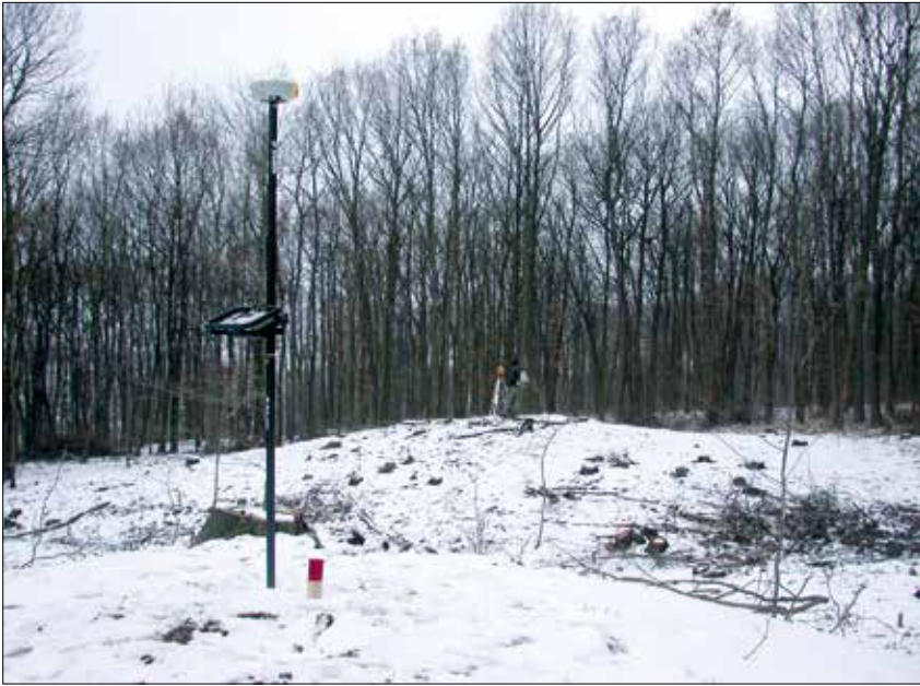
Abb. 2 Vermessung der Grabhügel 1 bis 3 bei winterlichen Verhältnissen 2004/05.