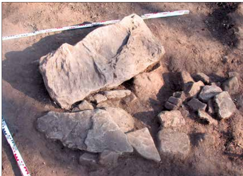
Abb. 4 Grabhügel 1, Bef. 5: Steinkonzentration mit größerem Stein im Hügelmantel. Möglicherweise war der größere Stein als Stele auf dem Hügel aufgestellt.

auch eine Betrachtung der Grenzsteine. Hier verlief die Kreisgrenze Eckartsberga-Querfurt, die auf dem historischen Messtischblatt 2747 eingetragen ist 4 .