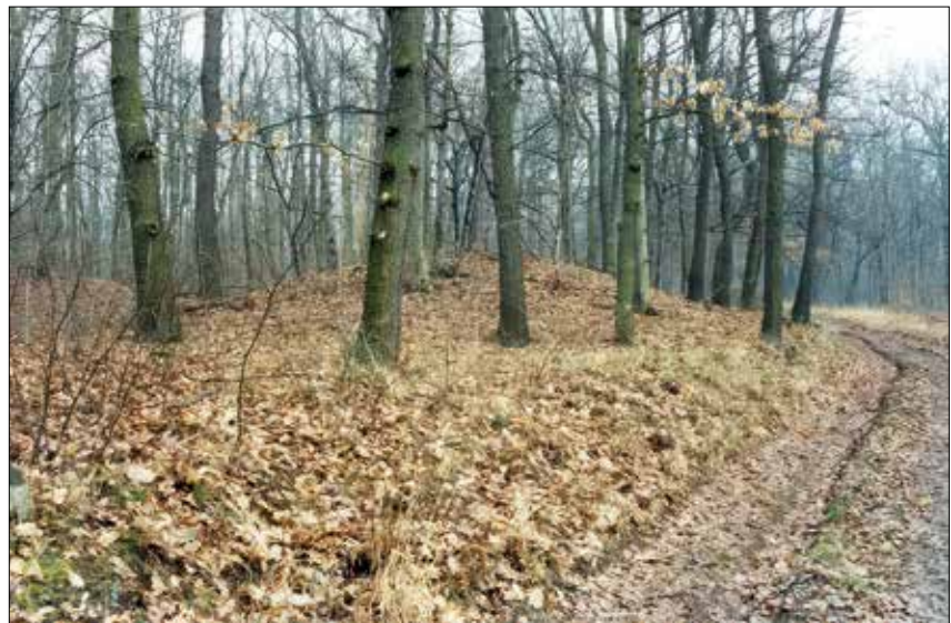
Abb. 1 Der Grabhügel 1 am Eichberg bei Memleben, Burgenlandkreis, im Jahr 2000.

Die Grundlagen für die Untersuchung des Hügels 1 wurden im Jahr 2004/05 gelegt. Im Winter 2004/05 erfolgten durch Studierende der Martin-Luther-Universität Halle-Wittenberg (MLU) unter der Leitung von A. Northe, zeitweise mit Anleitung durch die ehrenamtlichen Beauftragten B. W. Bahn sowie W. Fieber archäologische Feldbegehungen im nördlichen Waldgebiet 3 . Dabei wurde auch die östlich gelegene Altenburg bei Wangen, Burgenlandkreis, begangen sowie der Verlauf der Hohlwege nachvollzogen. Weiterhin erfolgte