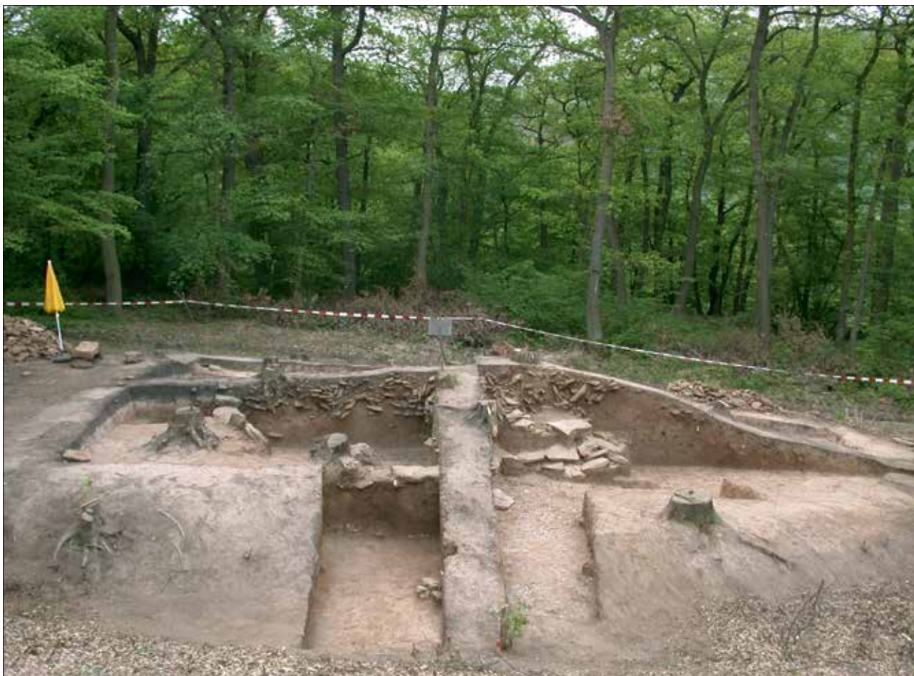
Abb. 6a Ausgrabungssituation des Grabhügels, Blick von Norden. Deutlich erkennbar sind der Nordwest- und der Nordost-Quadrant, die dazwischenliegenden Profilstege sowie die Schnitte durch den Hohlweg im Bildvordergrund. Auf der linken Bildseite ist der Meilerplatz über dem östlichen Grabhügelbereich anhand der schwarzen Holzkohleauflage verifizierbar. Die Steine der bronzezeitlichen Bestattungsphase sind in den Profilen deutlich sichtbar. Im rechten Quadranten liegen an der Grabungsbasis die Steine des Mauerammergrabes und darüber die der bronzezeitlichen Zentralbestattung (Abb. 6b und c – Profilzeichnungen – im Anhang S. 72–73).

bergen war, und der andere Teil der Bestattungen noch in den Profilstegen zu verbleiben hatte. Diese wurden erst in der Schlussphase der Untersuchung nach erfolgter Profildokumentation beim Abbau der Stege dokumentiert und geborgen. In der dokumentarischen Nachbereitung erfolgte dann die zeichnerische Darstellung der Gesamtsituation der Bestattungen.